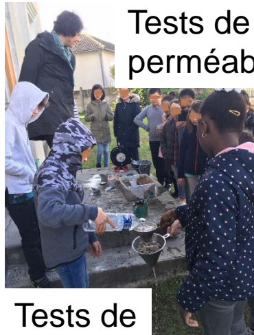
Tests de perméabilité

Classe d'eau avec le BRGM et SIGES Centre Au fil de l'eau Découvrez comment l'eau sous nos pieds arrive dans les rivières Ecole Henri Barbusse à Chalette-sur-Loing