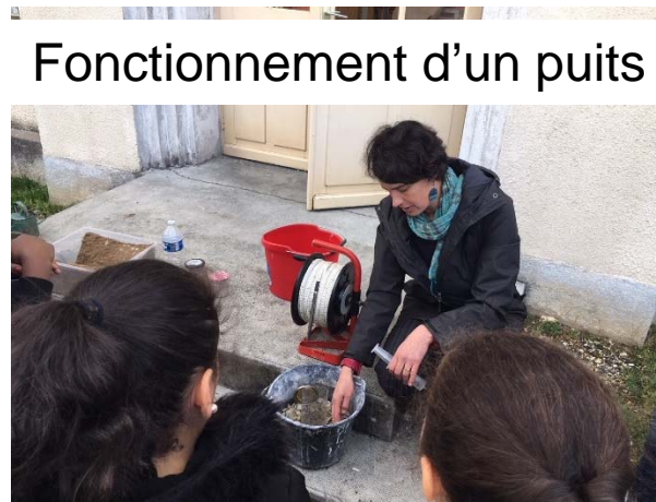
Fonctionnement d'un puits