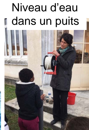
Niveau d'eau dans un puits

Classe d'eau avec le BRGM et SIGES Centre Au fil de l'eau Découvrez comment l'eau sous nos pieds arrive dans les rivières Ecole Henri Barbusse à Chalette-sur-Loing